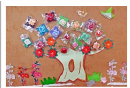
デイサービス利用者の作品