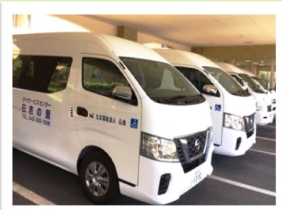
デイサービスの送迎車